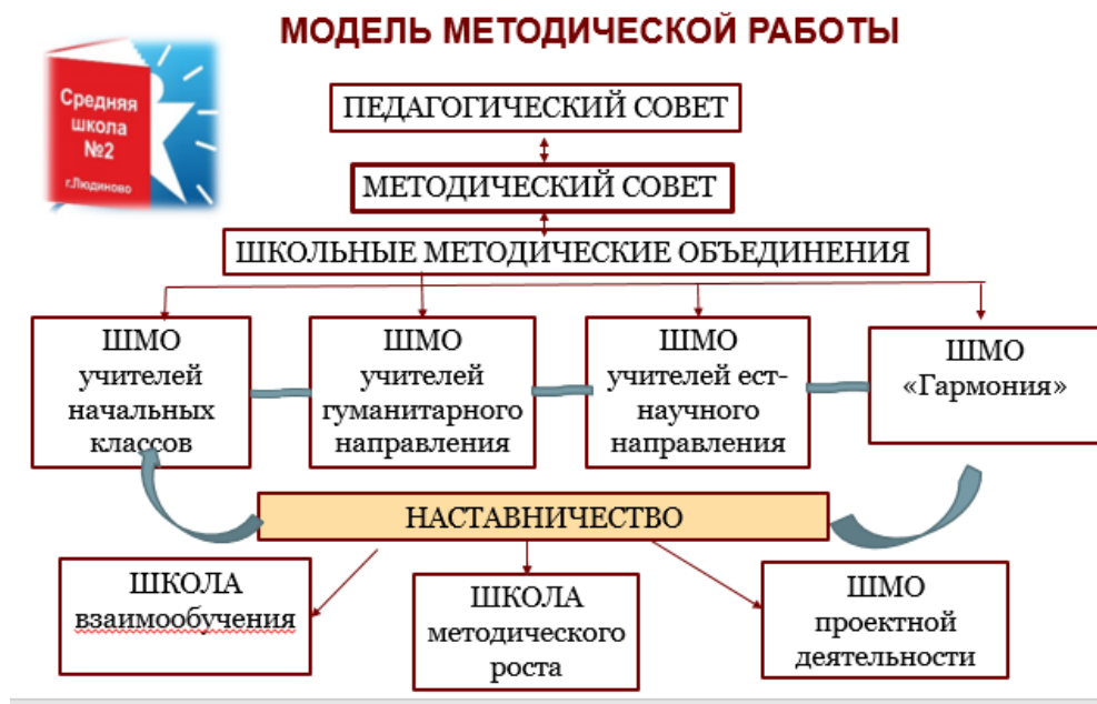
Схема. Модель методической работы МКОУ «Средняя школа №2»